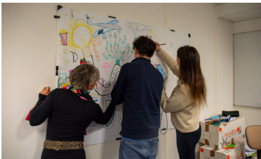
Participants du projet dessinant la fresque