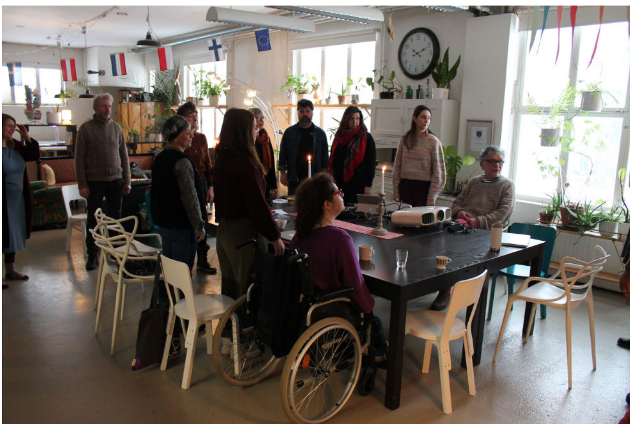
Les participants à IDEA lors de la mobilité en Finlande